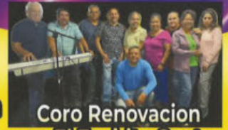
Coro Renovacion en El Espiritu Santo

Iglesia Maria Inmaculada Salon Padre Luciano 10390 Remick Ave., Pacoima, CA 91331